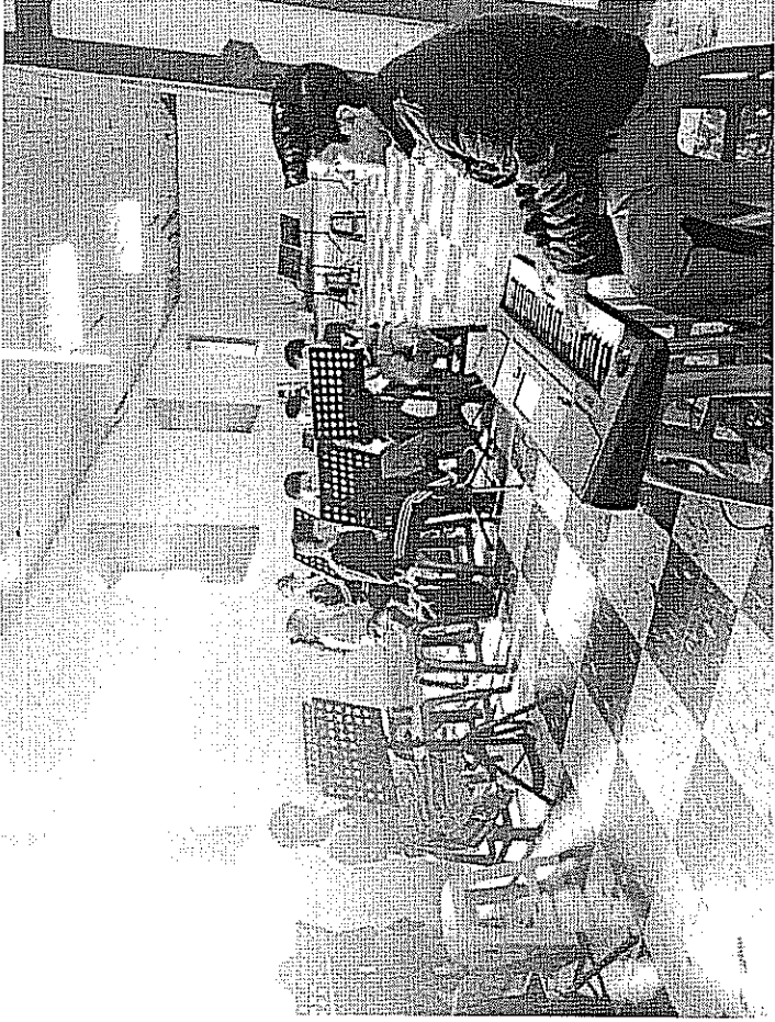
ACTIVIDAD DESARROLLADA Afinación, realizada el día 24 de Octubre de 2017.